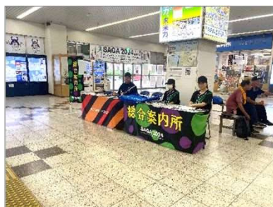
総合案内所(唐津駅内)