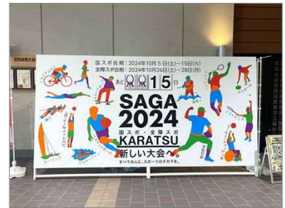
カウントダウンボード