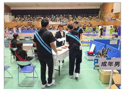
識別(赤:医療・青:市実行委)