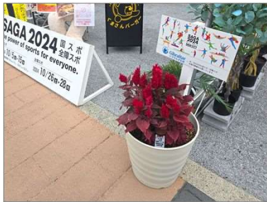
花いっぱい運動(企業)