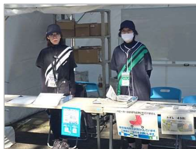
識別(白:市職員・緑:ボランティア)