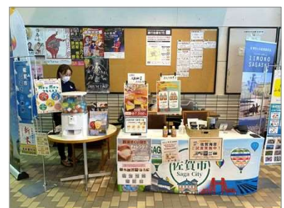
ふるさと納税ブース