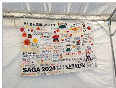
応援メッセージ(小学校)