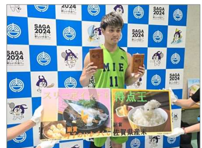
記念品作成(唐津工業高校)