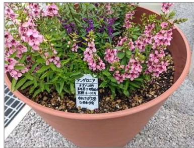
花いっぱい運動(大学)