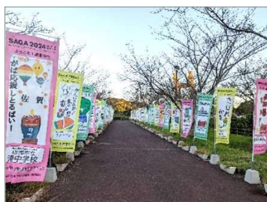
学校応援のぼり旗