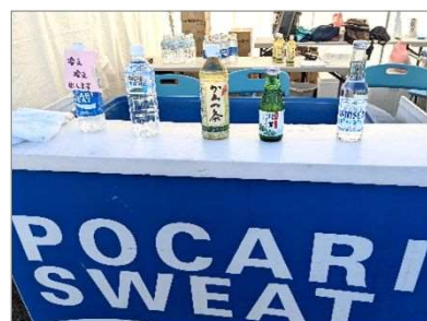
ふるまいドリンク