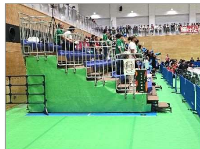
仮設スタンド(バレー)