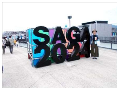
会場モニュメント