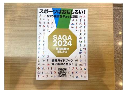
観戦ガイドブック