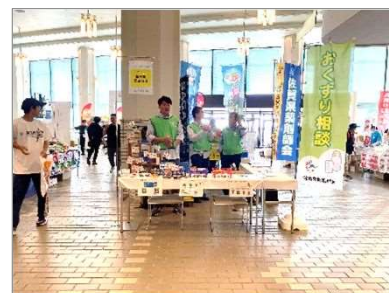
アンチドーピング広報(薬剤師会)