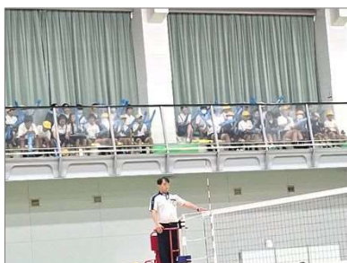
学校応援(幼・小・中・高)