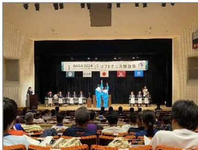
監督会議・開始式