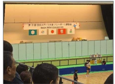
競技本部・実施本部