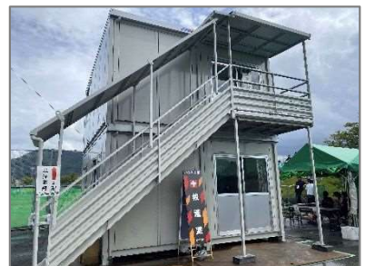
競技本部・実施本部