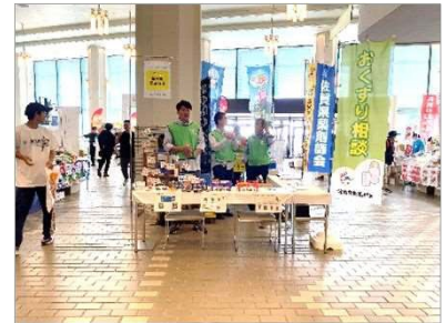
アンチドーピング広報(薬剤師会)