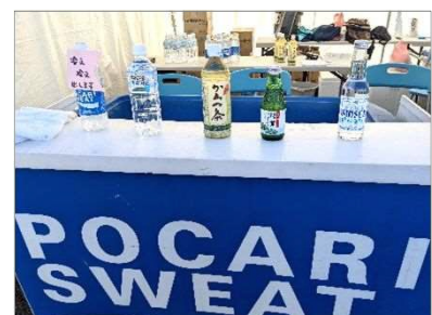
ふるまいドリンク