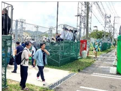
観客席・照明(ソフトテニス)