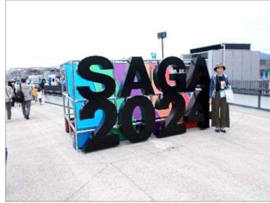
会場モニュメント