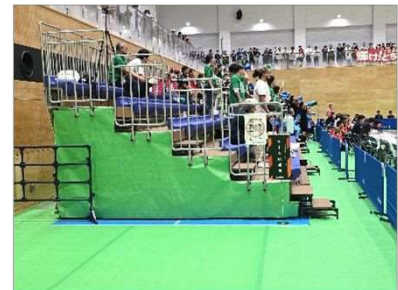
仮設スタンド(バレー)