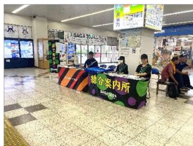
総合案内所(唐津駅内)