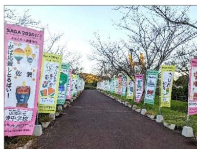
学校応援のぼり旗