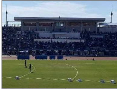
ロイヤルボックス